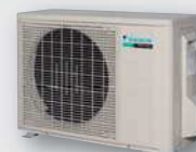
RXS-G / RKS-G

Equipées jusqu'aux tailles 50 de compresseur Swing, une technologie 100 % Daikin. Les + : Bas niveaux sonores - Bon rendement